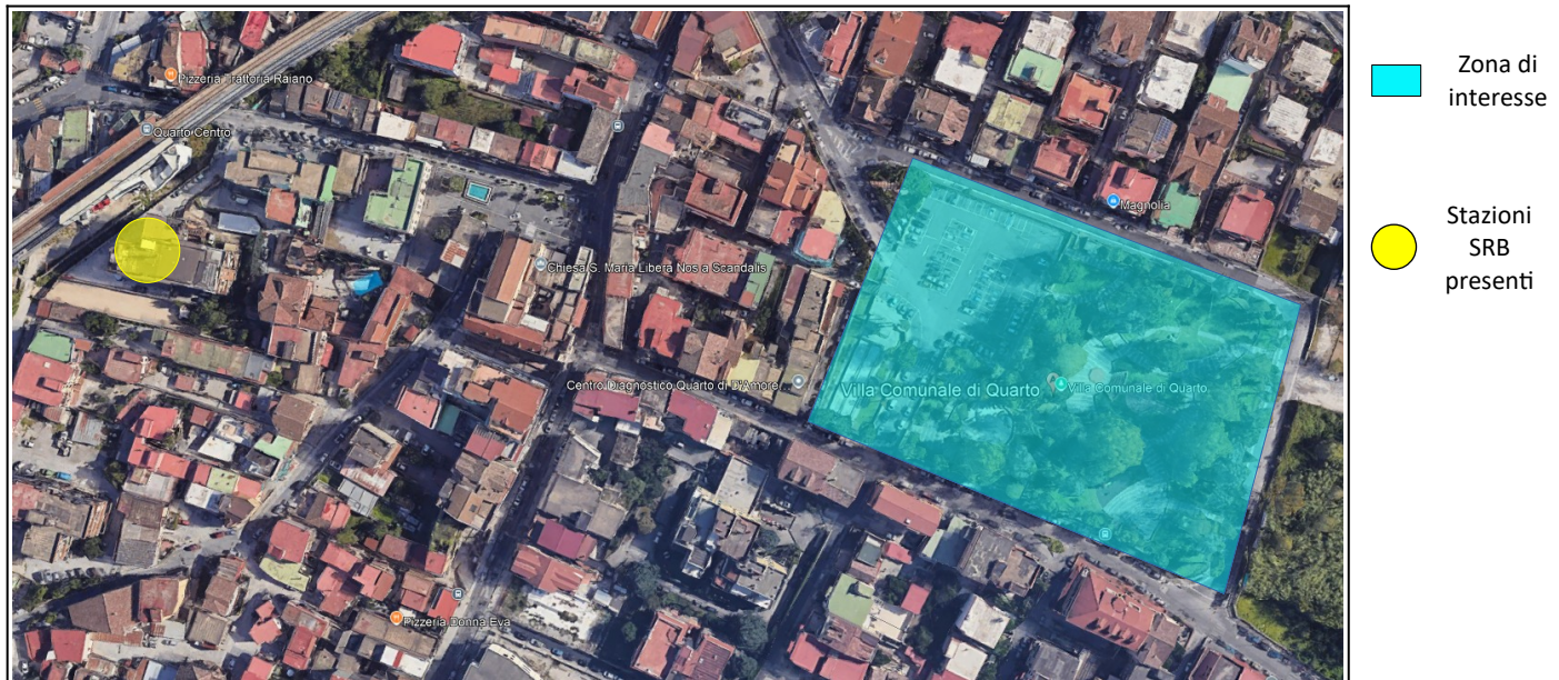
Figura 1 - Panoramica generale dei siti attenzionati presso la Villa Comunale di Quarto (NA)

(Long. 14°08'46.39"E, Lat. 40°52'37.24"N).